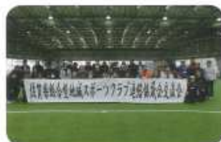
▲ 総合型地域スポーツクラブ連絡協議会交流会