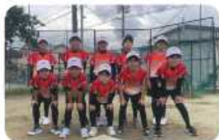
※ソフトボールは現在小学生は活動中