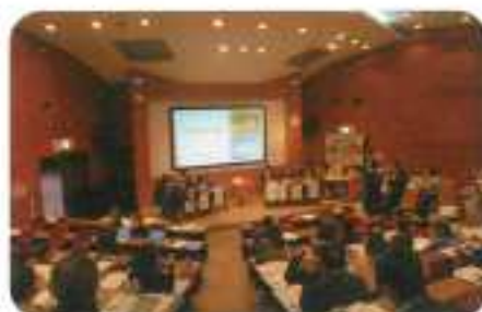
▲ 九州ブロッククラブネットワークアクション 2023 in 大分