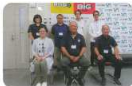
▲ 令和5年度佐賀県公認アシスタントマネジャー 養成講習会 受講生の皆さん